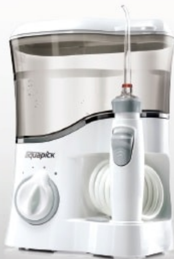
AQ-300 Made in Korea